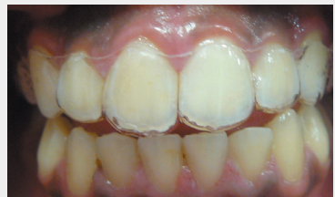
Gouttière de contention

Un fil de contention collé est mis en place derrière les dents du bas.