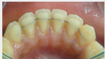
Fil de contention